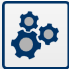
Sistemas de energia