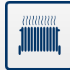
Equipamentos de energia