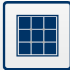
Sistemas de energia renovável