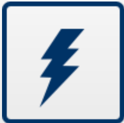
ESE – empresa de serviços de energia

Disponibilizamos assistência durante o tempo de vida útil dos sistemas de energia, nomeadamente serviços de manutenção preventiva e corretiva, otimizando permanentemente os equipamentos já instalados.