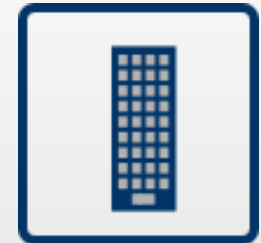
Manutenção técnica de edifícios