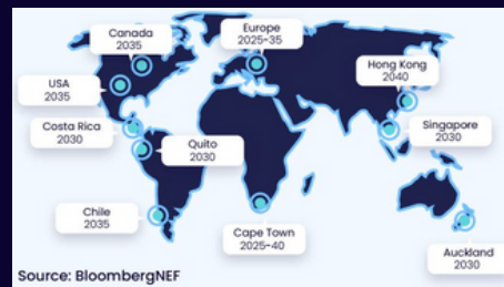
Projeção de transição de veículos de combustão interna para eléctricos por país / zona económica.

Se a sua empresa necessitar de substituir a sua frota em breve, apostar num veículo de combustão interna que poderá sofrer de restrições à sua circulação dentro do seu tempo de vida, ou num veículo eléctrico com os requisitos errados, pode ser financeiramente devastador.